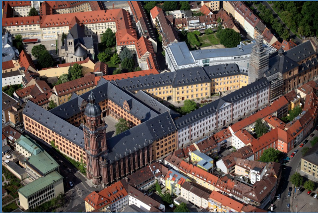
Alte Universität, Würzburg, © Gerhard Lauer.